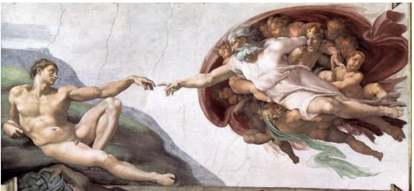
Afbeelding 2. Bijbel: 'De Schepping van Adam' (Michelangelo)

In Genesis 1.27 staat: 'En God schiep den mens naar zijn eigen beeld; naar het beeld van God schiep Hij hem; man en vrouw schiep Hij ze' . En in Genesis 2.7: 'En de Heere God had den mens geformeerd uit het stof der aarde, en in zijn neusgaten geblazen den adem des levens; also werd de mens tot een levende ziel' . Deze beschrijving geeft aanleiding tot het denkbeeld dat God en mens twee gescheiden entiteiten zijn en dat de mens God als de scheppende macht buiten zichzelf beschouwt. Een prachtige illustratie van deze bijbeltekst is het schilderstuk 'De schepping van Adam' van Michelangelo dat het plafond van de Sixtijnse Kapel van het Vaticaan in Rome siert (Afbeelding 2). Het is echter de vraag of Michelangelo hierin slechts de letterlijke tekst in Genesis tot uitdrukking wilde brengen dat de mens naar het beeld van God is geschapen of dat het een symbolische weergave is van een dieper aspect van de mens-God relatie.